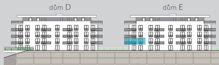
pohled od JIHOVÝCHODU