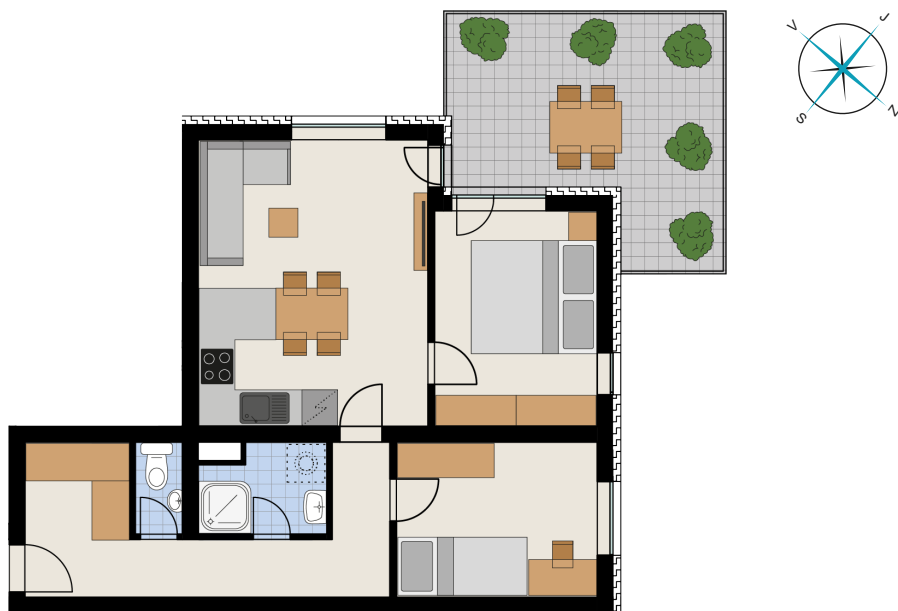
Umístění bytu na podlaží